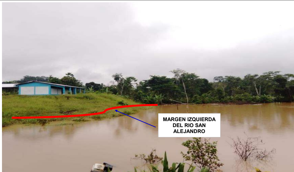
FIGURA N° 01: TRAMO CRÍTICO EN EL RIO SAN ALEJANDRO, SECTOR CASERIO BUENOS AIRES, DISTRITO DE IRAZOLA, PROVINCIA DE PADRE ABAD, DEPARTAMENTO DE UCAYALI.