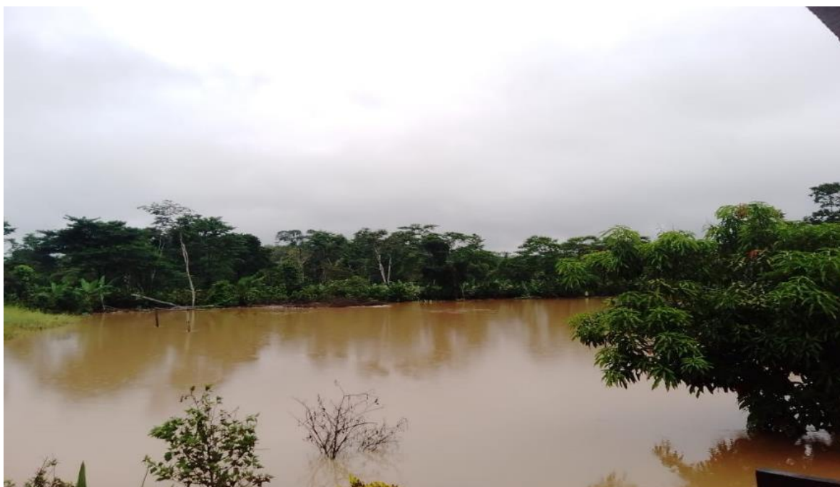
FIGURA N° 02: EL RIO SAN ALEJANDRO EXPUESTO ANTE UN DESBORDAMIENTO EN EL CERCADO A LA POBLACION, CASERIO BUENOS AIRES